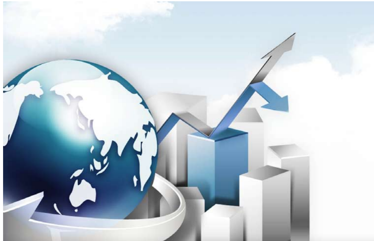
최근 3년간 영업실적/재무상태 요약

2012년은 안정적 해외사업 확대와 내실 있는 관리를 통하여 대우건설이 글로벌 EPC 리더로 도약하기 위한 기반을 구축한 한 해였습니다.